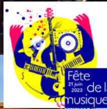
LE MOBYLETTE SOUND SYSTEM