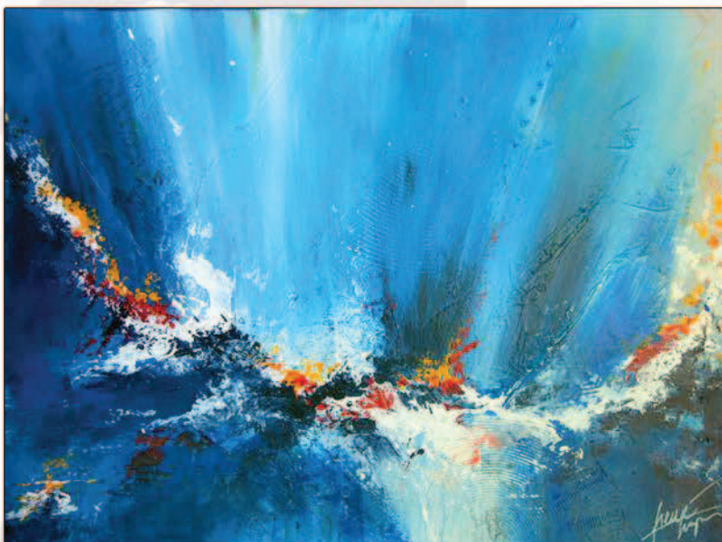
Aquatica - 81x60 cm - Acrylique sur toile