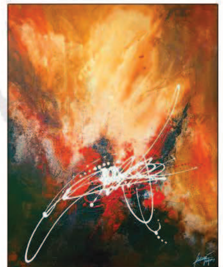
Automne - 100x80 cm- Acrylique sur toile